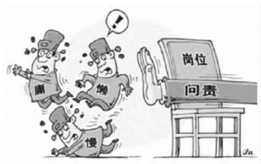
“让位” 作者：徐骏