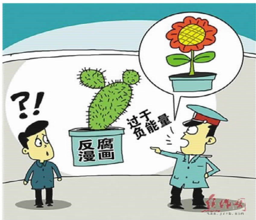
反腐过于负能量？ 原载中评网